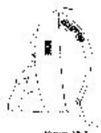
Figura N° 3

ARTICULO 7°: Las Secretarías Regionales Ministeriales de Educación serán responsables de cautelar el cumplimiento del presente decreto, sólo en lo que dice relación con uso de uniforme escolar, a través de los Departamentos Provinciales de Educación correspondientes.