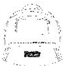
Figura N° 1