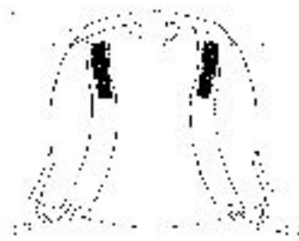
Figura N° 2